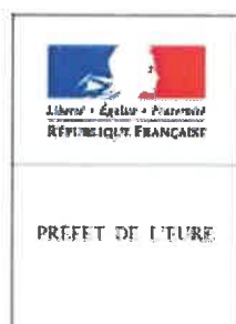
Schéma départemental d'accueil des Gens du Voyage du département de l'Eure 2019-2025